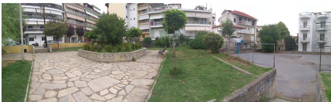
Εικ. 5-6-7 Απόψεις της υφιστάμενης κατάστασης της Πλατείας Ελευθερίας