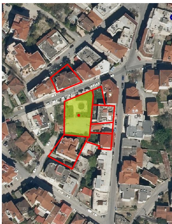
Εικ.1-2 Η πλατεία Ελευθερίας (συντεταγμένες κέντρου 366102.52|4516616.03).